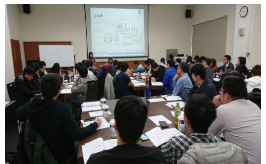
▲上課&圖面討論及演練